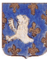
Moreuil : représentation ancienne